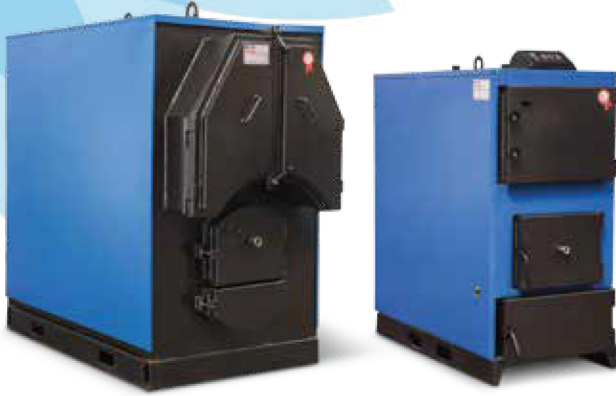
ÜKYP Prizmatik Kazanlar